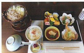
あざれの会席は季節感たっぷり

宝塚市国際観光協会 〒665-8665 兵庫県宝塚市東洋町1-1 TEL 0797-77-2012 (お問い合わせのみ) FAX 0797-74-9002 ※5人以上の団体でご参加を希望の方はお申込前に事務局へお問い合わせください